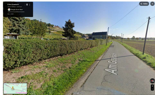
Blick entlang der Straße Am Gosebach, links im Bild das Flurstück 91/1 und im Hintergrund die vorhandene Bebauung auf dem Flurstück 92/1 der Gemarkung Golk