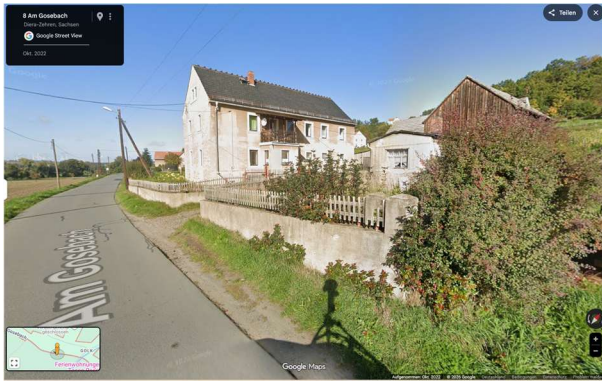
Blick entlang der Straße Am Gosebach, rechts im Bild die vorhandene Bebauung auf dem Flurstück 92/1 der Gemarkung Golk