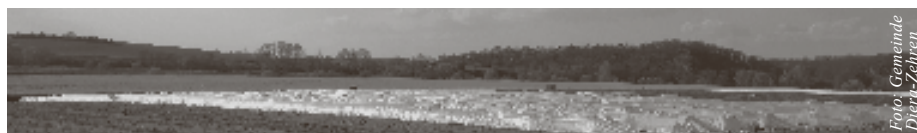
Blick über die Spargelfelder zur Elbe in Nieschütz