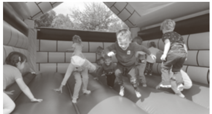
Das Team der „MS Sonnenschein“

Ein großes „Danke!“ geht an alle Geld- sowie Sachspender, durch welche der Kindertag für unsere Kinder zu einem tollen Fest werden konnte.