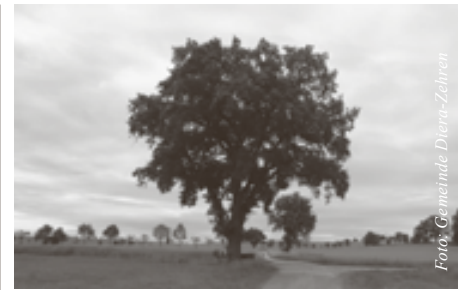
Zwischen Golk und Naundörfel