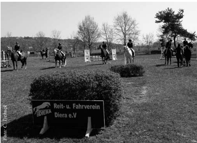
Siegerehrung der Dressurreiter

Es versammelten sich zahlreiche Zuschauer um den Turnierreitplatz des Reit- und Fahrvereins Diera e.V., um den Reitern und Gespannen die Daumen zu drücken.