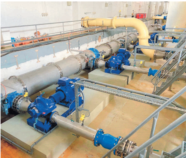
Im Wasserwerk Fichtenberg wurden in den Jahren 2019/2020 die Reinwasserpumpen und der Saugkollektor erneuert. 2020 erfolgt die letzte Teilmaßnahme als „Los 5“.

Diese Maßnahme kostet voraussichtlich 60.000 Euro.