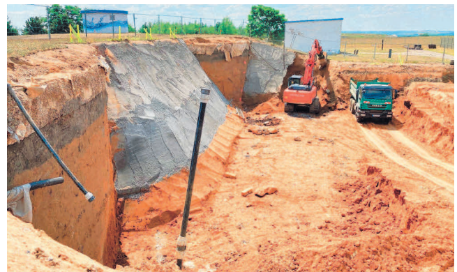
Die Arbeiten zum Neubau des Bediengebäudes am Hochbehälter Weida sind in vollem Gange. Die Fertigstellung ist für nächstes Jahr vorgesehen.

Investiert werden hier rund 2,1 Mio. Euro.