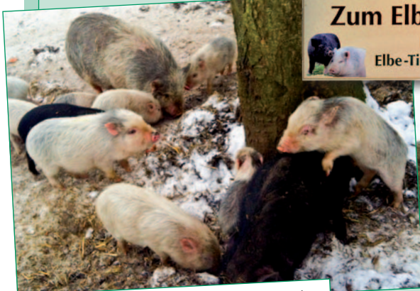
Die kleinen und großen Schweinchen fühlen sich wohl – auch bei Winterwetter