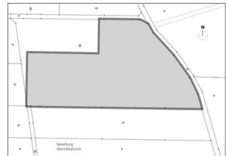
Plangebiet Vorhabenbezogener Bebauungsplan „Biogasanlage In-Trust“