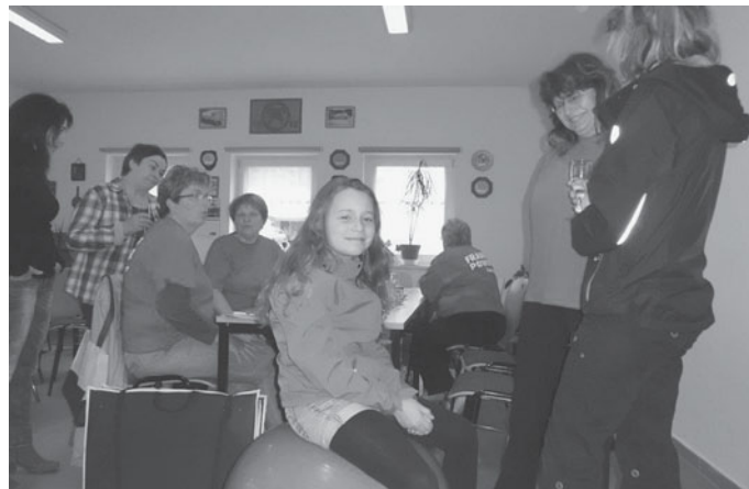
Gymnastik-Pop-Verein Zehren e. V.