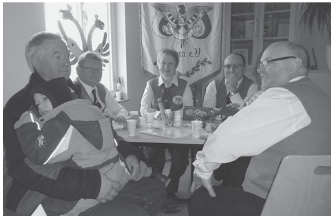
Schützenverein Diera e. V.