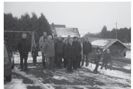
Hebelei-Direktvermarkter zu Besuch auf dem Hofgut Kaltenbach in Thiendorf-Welxande