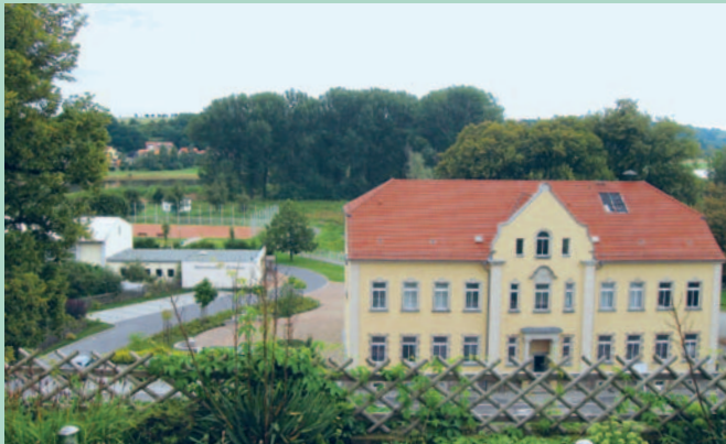
Bürgerhaus Zehren mit entstehender Zahnarztpraxis