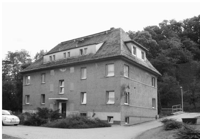
Seebuschter Weg 7 mit 5 Wohneinheiten, teilsaniert