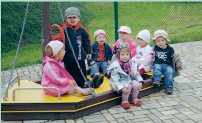
Neues Boot für die Krippenkinder in der Kita Zehren