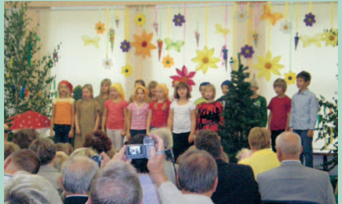
Programm anlässlich des Schulanfanges