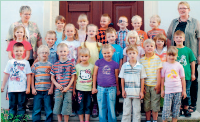
Schulanfänger der Grundschule Zadel