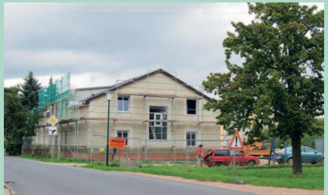
Baufortschritt FFW Diera