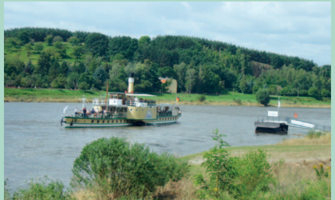
Dampfer der Weißen Flotte auf der Elbe vor dem Tierpark Hebelei