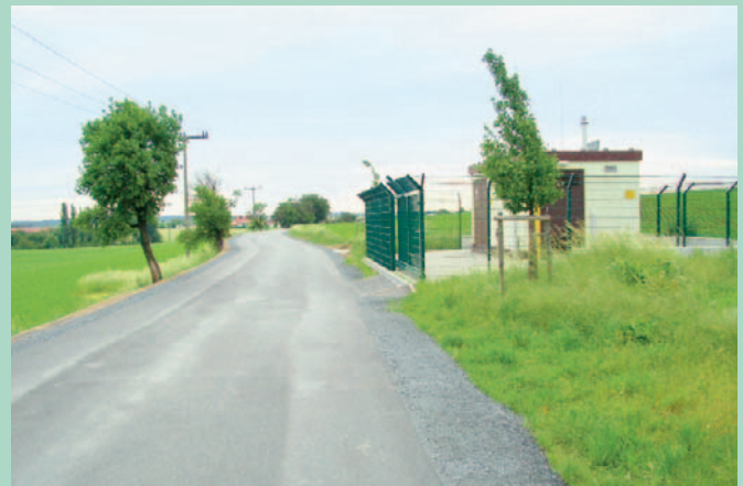
Straße Diera–Zadel nach Fertigstellung