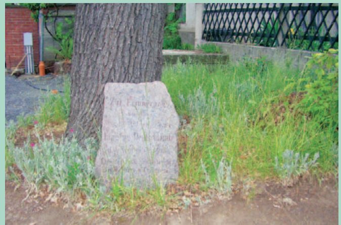
Gedenkstein in Zadel, Dorfanger

Die Tagesordnung dafür entnehmen Sie bitte eine Woche vorher den amtlichen Schaukästen.