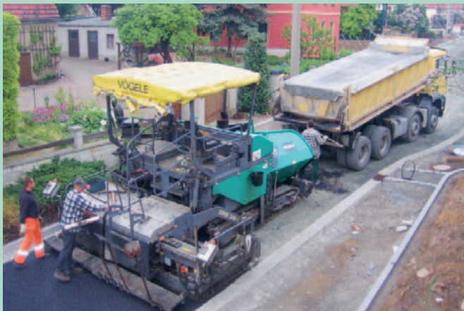
Baufortschritt Dorfanger Zadel