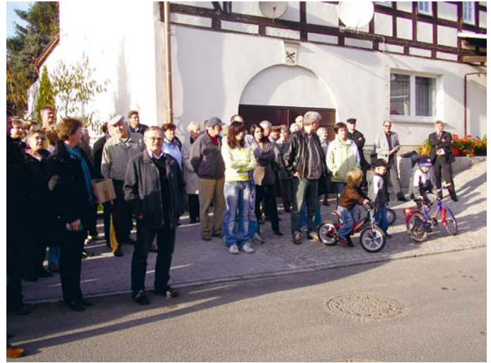
Vor der Eröffnung an „Der alten Schmiede“