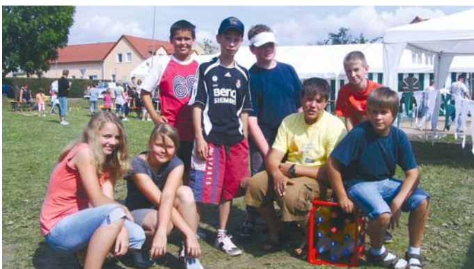
Beim Schützenfest in Diera im August belegte unsere Mannschaft den 7. Platz