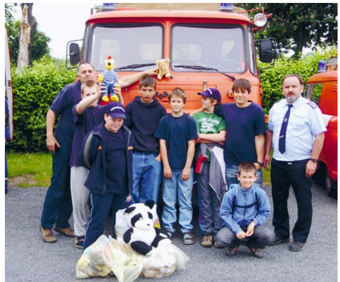
Sammelaktion von Spielzeug der Dieraer Kinder für Kinder in Tansania (Juni 2008)