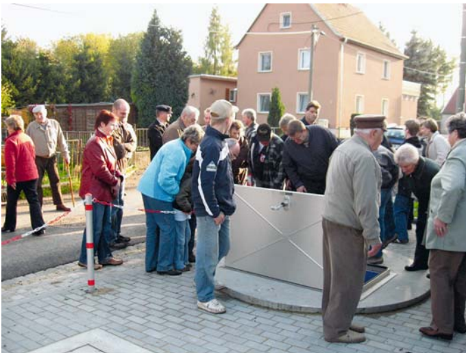
Besichtigung des Pumpwerkes in Wölkisch