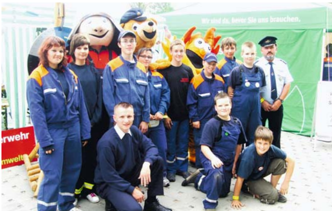
Die Jugendfeuerwehr Diera vertrat unsere Gemeinde gemeinsam mit der Kreisjugendfeuerwehr Meißen beim Landsjugendfeuerwehrtag vom 20. bis 22. Juni 2008 in Reichenbach (Vogtland). Hier präsentierten sich die Jugendfeuerwehren aus ganz Sachsen unter dem Motto „Jugend gegen Rechts“ und „Schonender Umgang mit unserer Umwelt“. Einer der Höhepunkte war die Übergabe von Kinder-Spielzeug, welches die Dieraer Kinder für Kinder in Tansania gesammelt hatten.