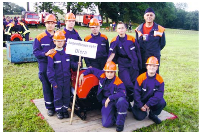
Beim Löschangriff in Ziegenhain am 6. September 2008 belegten die Mannschaften Diera I und Diera II den 1. und 2. Platz