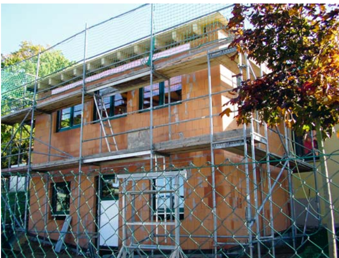
Baufortschritt des neuen Hauses der Kita Nieschütz