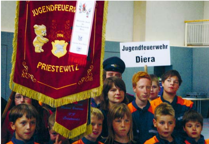
Zu Gast bei der Fahnenweihe der Jugendfeuerwehr in Priestewitz am 14. September 2008