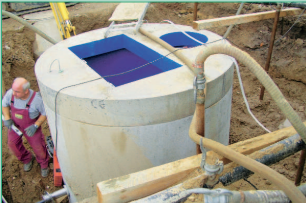
Setzen des Abwasserpumpwerkes Wölkisch