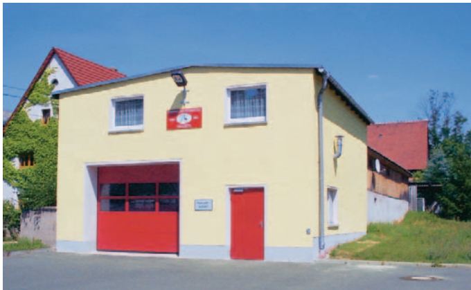
Wie bereits im Amtsblatt Juli 2008 veröffentlicht, ist nun die Fassade des Feuerwehrgebäudes der Ortswehr Nieschütz fertiggestellt