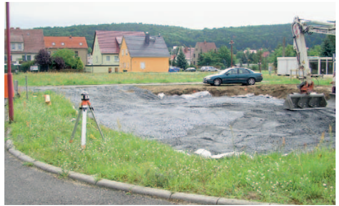
Das Wohnbaugebiet Nieschütz I wächst weiter – Baugrube für neues Eigenheim, im Hintergrund Neuerrichtung einer Verkaufsstelle