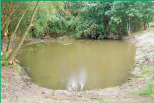
Nach der Beräumung des Feuerlöschteiches im Ortsteil Seebuschütz