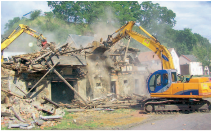
Abriss Fachwerkhaus B 6 – Niedermuschützer Straße in Zehren durch die Fa. Hoch- und Tiefbau Nitsche, Obermuschütz