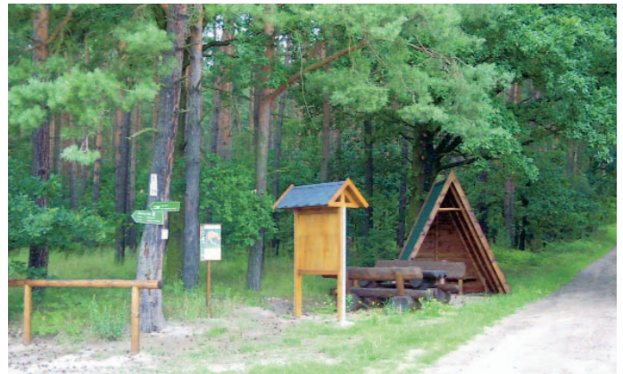
Der neu geschaffene Rastplatz für den Fernreitweg unterhalb des Golkwaldes zwischen Naundörfel und Golk