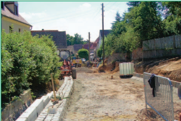
Baumaßnahme Wölkisch – Wiederherstellung der Straße „Zur Alten Schmiede“