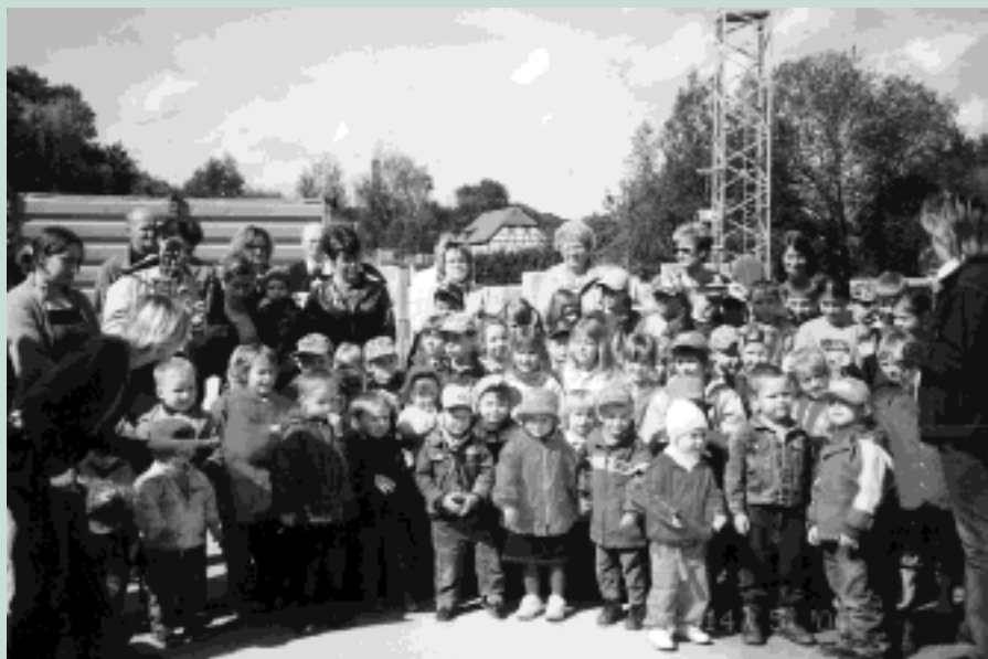
Kinderprogramm zur Grundsteinlegung des Kindergartens in Zehren am 14.05.2004